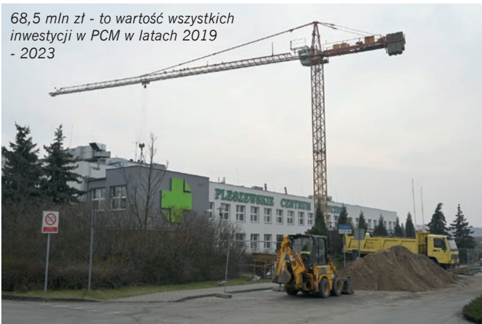
68,5 mln zł - to wartość wszystkich inwestycji w PCM w latach 2019 - 2023