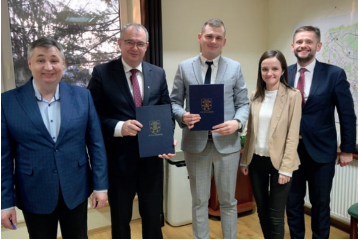
Podpisanie umowy między powiatem, a firmą przewozową Euromatpol

Od początku roku działa w Powiecie Pleszewskim nowa komunikacja autobusowa - PLESZEWSKIE PRZEWOZY LOKALNE PPL.