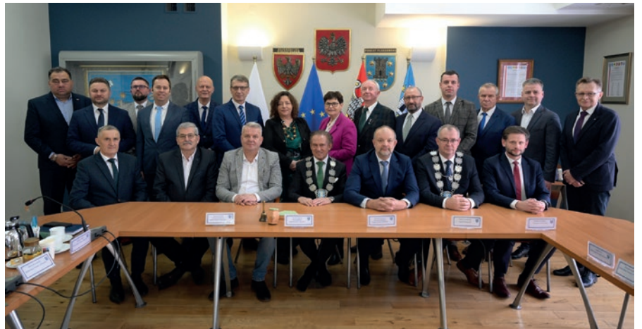
Rada Powiatu VI kadencji w Pleszewie (XII.2023 r.)