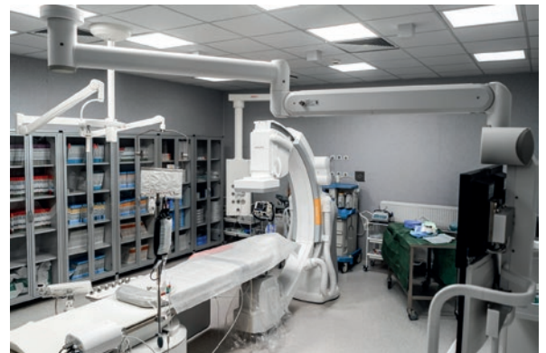
Ultranowoczesny angiograf cyfrowy Artis Q dla Zakładu Radiologii Zabiegowej kosztował 4,5 mln zł (WRPO 2014-20).

Ogromne środki PCM inwestuje w nowoczesną aparaturę medyczną i wyposażenie. W tym roku z Funduszu Medycznego chce kupić: tomograf za 4,65 mln zł, dwa aparaty USG (965.000 zł), nowy ambulans (600.000 zł), dwa stoły operacyjne (420.000 zł). Z własnych środków spółka planuje zakup mebli szpitalnych, całego wyposażenie kuchni i stołówki oraz aparaturę medyczną o wartości 3,1 mln zł.