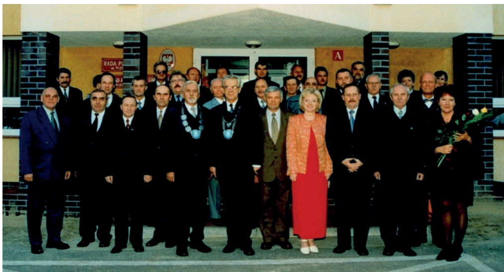
Rada Powiatu w Pleszewie I kadencji (1998 - 2002)