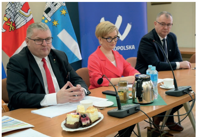
(tw) Podsumowanie finansowania z PROW 2014-2020 w Pleszewie