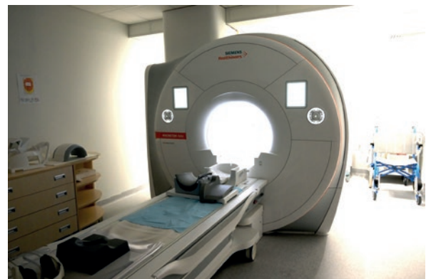
Nowy rezonans magnetyczny szpital zakupił w 2022 r. za 7,5 mln zł z Funduszu Przeciwdziałania COVID-19